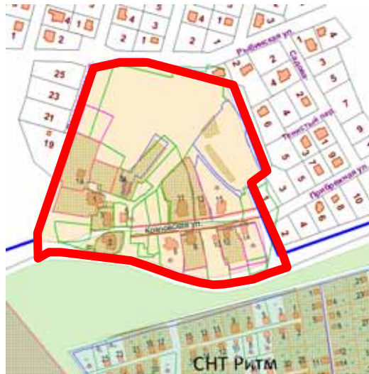
Схема для подготовки проекта планировки Территории:

В соответствии с Генеральным планом Территория расположена в функциональных зонах: